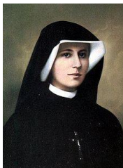
Hermana Faustina (Apóstol de la Misericordia)