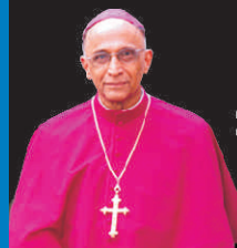
Son Excellence Bernard Moras Archevêque de Bangalore