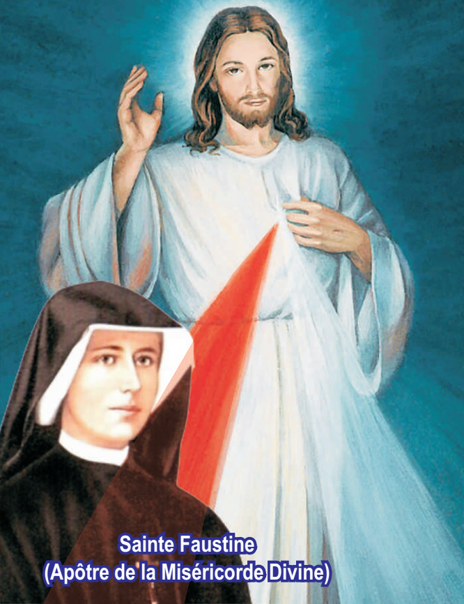
Sainte Faustine (Apôtre de la Miséricorde Divine)